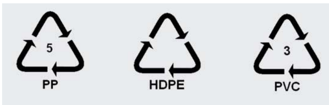
Obr. 1 Grafické označovanie plastových obalov

Výrobcovia pre uľahčenie označujú obaly grafickými značkami (obr.1), ktoré sú doplnené písomnými a číselnými údajmi.