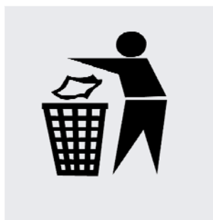
Obr. 2 Grafické zobrazenie panáčika so zbernou nádobou

Okrem týchto informačných symbolov sa na plastových obaloch nachádza aj grafický znázornený panáčik odhadzujúci nepotrebný obal do zbernej nádoby (obr.2).